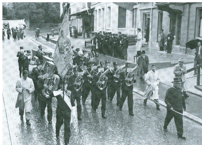
St. Gallen 1948

Es war eine erfolgreiche Teilnahme und das Selbstwahlstück „Die beiden Veroneser“ sowie der Marsch „Frei bleibt die Schweiz“ wurde mit „vorzüglich“ bewertet.