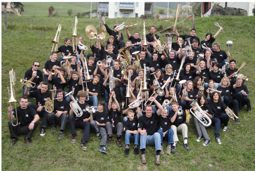
Abschlussfoto des Lagers 2010 in Sörenberg

Einmal mehr war das Lager der ABM Brass Power ein Erfolg und das Publikum durfte am eindrücklichen Abschlusskonzert vom 23. Oktober in der Mehrzweckhalle Auw sich von der musikalischen Ernte überzeugen. Das zahlreich erschienene Publikum dankte den Einsatz mit grossem und herzlichem Applaus.